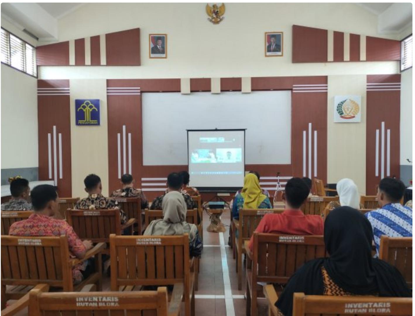
ASN Rutan blora ikuti pengrahan menteri kemenimipas

Blora - Rumah Tahanan Negara (Rutan) Kelas IIB Blora melaksanakan kegiatan pengarahan yang disampaikan langsung oleh Menteri Imigrasi dan Pemasarakatan, Agus Andrianto. Kegiatan ini diikuti oleh seluruh ASN di